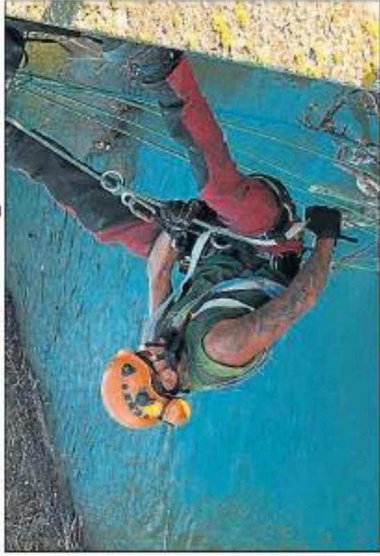
La descente de l'un des deux élagueurs volants.

sez difficile et longue en raison de la hauteur du niveau d'eau et d'un courant rapide n'a pas permis de mettre en place une barge pas loin de la pile pour évacuer plus facilement tout ce bois. Aussi, ce groupe d'ouvriers très spécialisés a dû installer une tyrolienne qui part de la berge en amont du pont côté Cuxac et rejoint la droite de la pile où se trouvent les embâcles.